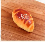
小羊角2入 $30 數量：_____