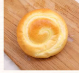
奶油麵包(克寧母) $25 數量：_____