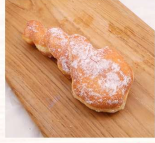
多拿茲 $30 數量：_____