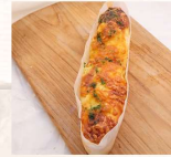
香蒜洋蔥培根 $40 數量：_____