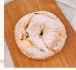
蔓越莓乳酪 $60 數量：_____