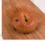
咖啡巧克力貝果 $38 數量：_____