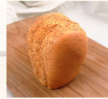
花生夾心 $30 數量：_____