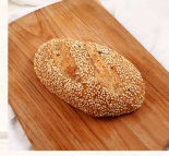
穀物那特 $50 數量：_____