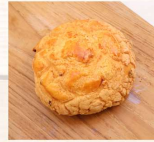
奶酥波蘿 $32 數量：_____