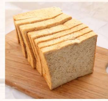
全麥土司 $55 數量：_____