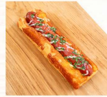
丹麥德腸 $50 數量：_____