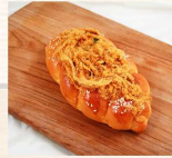
辮子肉脯 $38 數量：_____