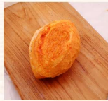
明太子法國 $45 數量：_____