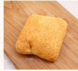
三星蔥起士 $40 數量：_____