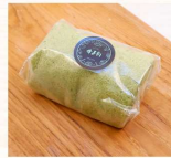
抹茶瑞士捲 $30 數量：_____