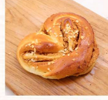
雙心花生 $25 數量：_____