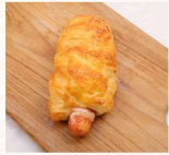
丹麥熱狗 $40 數量：_____