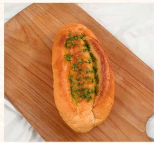
法國大蒜 $45 數量：_____