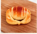
金牛角2入 $50 數量：_____