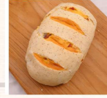
養身歐克 $50 數量：_____