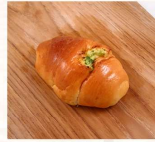
小熱狗2入 $30 數量：_____