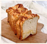
奶酥土司 $80 數量：_____