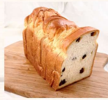
葡萄乾土司 $80 數量：_____