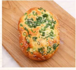
三星蔥 $30 數量：_____