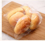
奶油餐包 $50 數量：_____