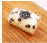
葡萄瑞士捲 $30 數量：_____