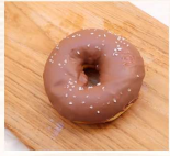
巧克力多拿茲 $30 數量：_____