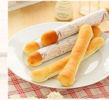
鮮奶棒 $30 數量：_____