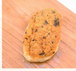
海苔肉鬆 $30 數量：_____