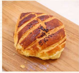
起酥肉鬆 $40 數量：_____