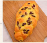
蘭姆葡萄 $50 數量：_____