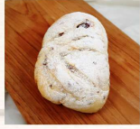
優格亞麻無花果 $65 數量：_____