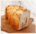
芋頭土司 $80 數量：_____