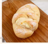
法式修脩 $50 數量：_____