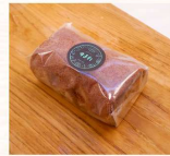
巧克力瑞士捲 $30 數量：_____