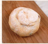
蘭姆水果 $70 數量：_____