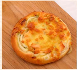
焗雞佛卡夏 $35 數量：_____