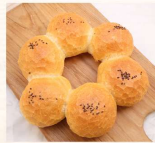
法式鮭魚圈 $65 數量：_____