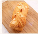
丹麥吐司 $60 數量：_____