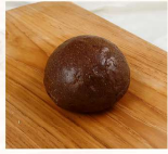
黑眼豆豆 $15 數量：_____