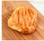
鹹蛋芋頭丹麥 $45 數量：_____