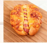
起士德腸 $45 數量：_____