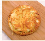
洋蔥佛卡夏 $35 數量：_____