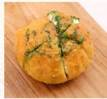
大蒜爆漿堡包 $48 數量：_____