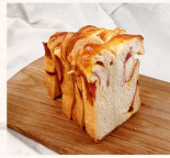
維也納起士火腿土司 $60 數量：_____