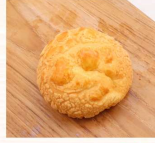
小波蘿 $15 數量：_____