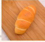
鹽可頌 $30 數量：_____