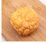
波蘿麵包 $25 數量：_____