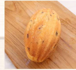
奶酥炸彈 $40 數量：_____