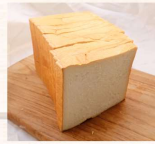
白土司 $50 數量：_____