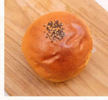
紅豆麵包 $25 數量：_____