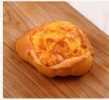
雙重起士羅宋 $45 數量：_____