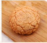
巧克力波蘿 $32 數量：_____