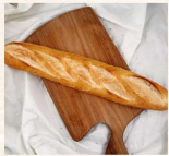
法國麵包 $55 數量：_____