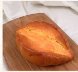
羅宋 $55 數量：_____