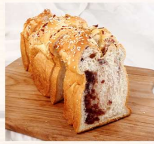
紅豆土司 $80 數量：_____