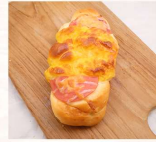
火腿起士 $30 數量：_____