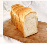
鮮奶吐司 $70 數量：_____