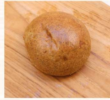
紫米桂圓 $15 數量：_____